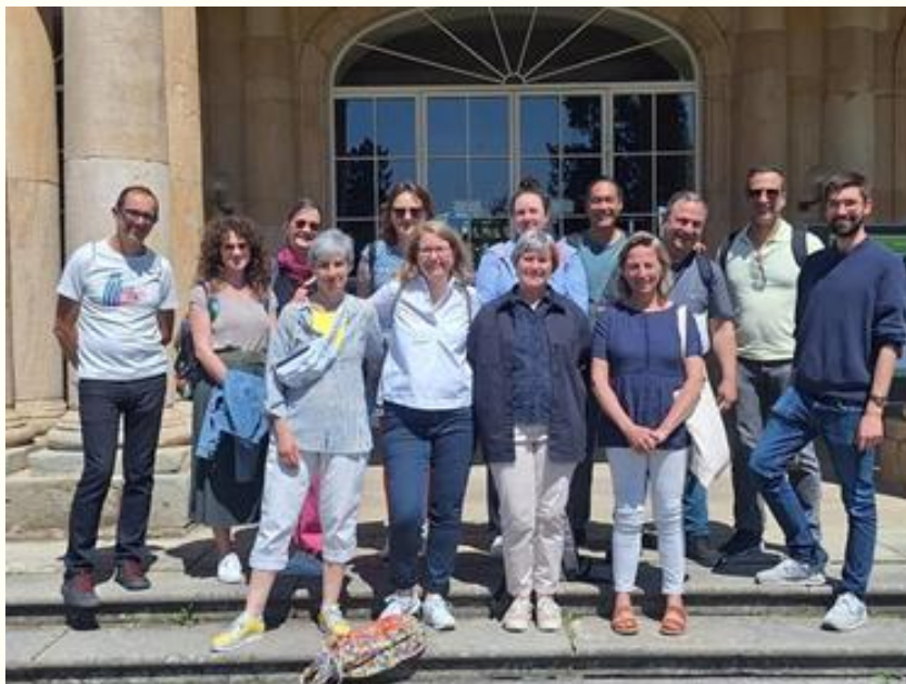
Participantes del Programa Academia 2024 en Alemania.