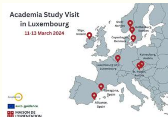
Países de origen de las participantes.

La orientación educativa es un proceso fundamental para el desarrollo personal y profesional del alumnado. En un contexto europeo cada vez más globalizado, es importante compartir experiencias y buenas prácticas entre los diferentes países para mejorar la calidad de la orientación que se ofrece a los estudiantes. El programa Academia en Luxemburgo reunió a profesionales de la orientación de Austria, Dinamarca, España, Irlanda, Noruega y Suecia con el fin de conocer el sistema de orientación luxemburgués, compartir conocimientos y experiencia entre los profesionales europeos de la orientación y desarrollarla reflexión sobre la cooperación estratégica a nivel nacional y local.