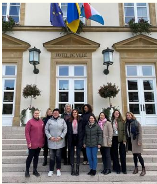
Participantes del Programa Academia Luxemburgo.

Del 11 al 13 de marzo de 2024, tuve la oportunidad de participar en el programa Academia 2024 en Luxemburgo, junto a otros ocho profesionales de la orientación de diversos países europeos. Durante tres días, exploramos el sistema de orientación luxemburgués, visitamos talleres para jóvenes y conocimos el funcionamiento de instituciones educativas a nivel nacional y local. Esta experiencia destacó la importancia de la orientación integral y la promoción de la empleabilidad entre los jóvenes.