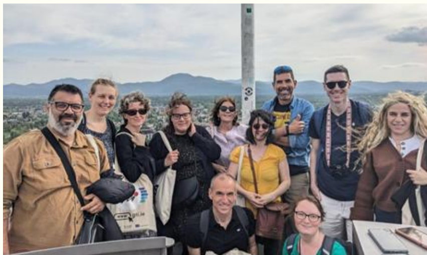
Participantes en Eslovenia Academia 2024.

https://drive.google.com/file/d/1SXqBPjSLJL_Lex7XFTM2SFlt8YhHLXtK/view?pli=1