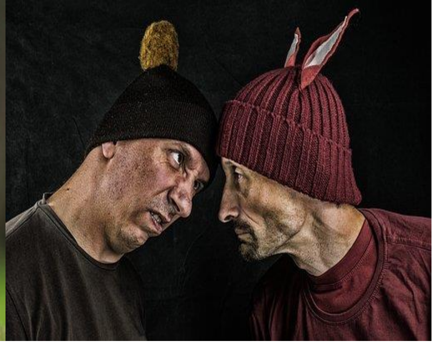
El enemigo “en casa”