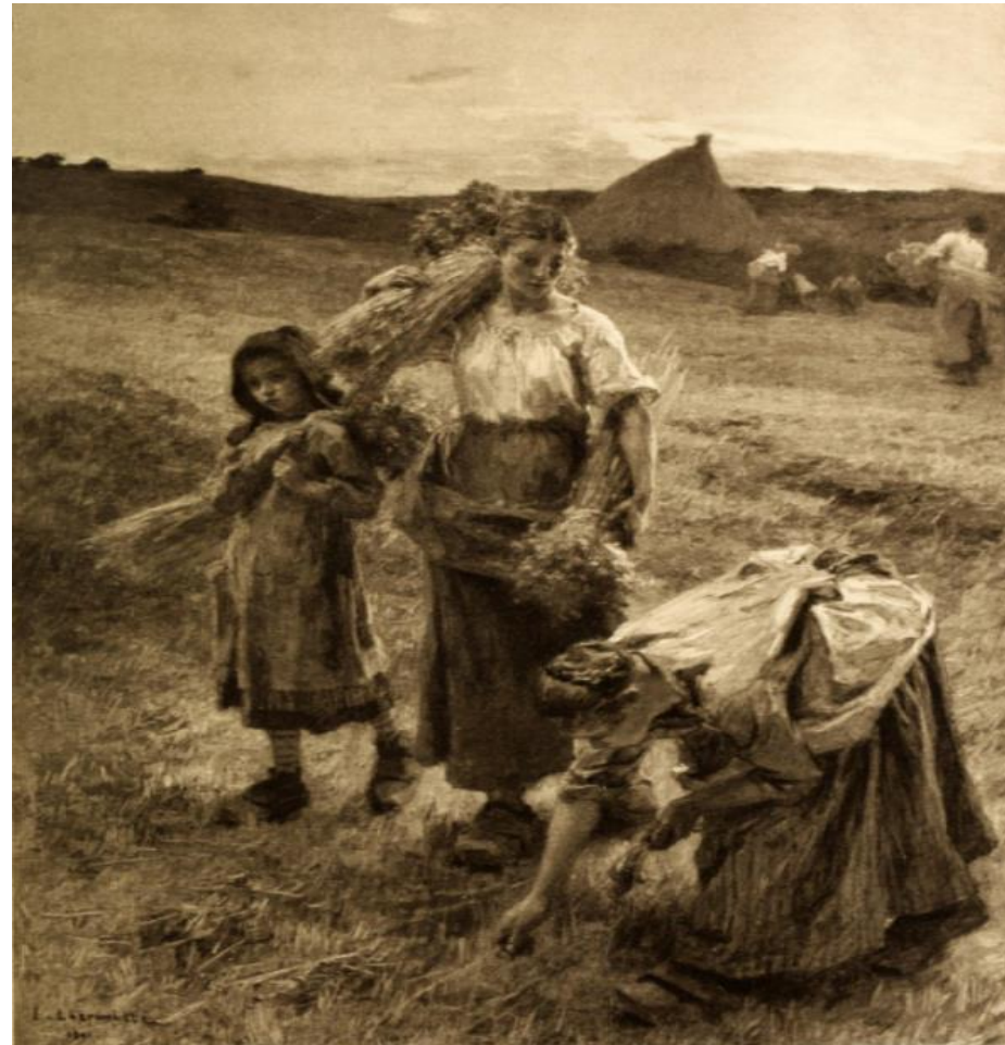
Léon Lhermitte (1844-1925)